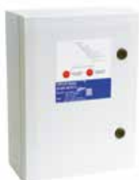
Coffret AXONE 1V/DES-Tri 25.4A T1