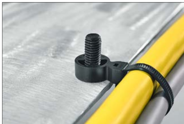
Lanière T50SOSSBD-M8/10, en application.