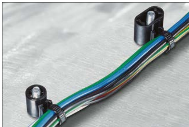
Cheminement des câbles au plus près du goujon.