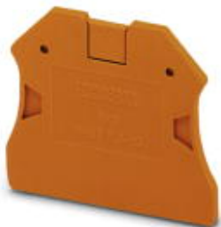
Flasque d'extrémité, Longueur: 47 mm, Largeur: 2,2 mm, Hauteur: 39,8 mm, Coloris: orange

Remarque : les données indiquées ici sont tirées du catalogue en ligne. Vous trouverez toutes les informations et données dans la documentation utilisateur. Les conditions générales d'utilisation pour les téléchargements sur Internet sont applicables. ( http://phoenixcontact.fr/download )