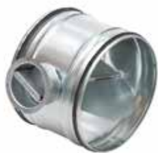
Registre RG à joints

Le registre RG à joints permet d'équilibrer un réseau circulaire tout en garantissant un très faible taux de fuite classe D (jusqu'à D315 inclus) ou C (à partir du D355).