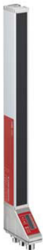
Figure pouvant varier