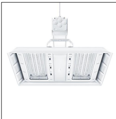
Luminaire industriel à LED CR2 M21k-840 PC WB LDO TEC-IP WH 42936400

La présente déclaration de produit environnemental (EPD) est basée selon les normes EN ISO 14025 et EN 15804 et décrit les impacts spécifiques environnementaux du produit mentionné. Cette déclaration fait suite également aux exigences spécifiques et concrètes du programme Institut Bauen und Umwelt e.V. (IBU) selon les règles de calcul des LCA et le contenu de l'EPD (de base) selon les instructions de PCR sous-jacentes (PCR: Règles de catégorie de produit) pour «Luminaires, lampes et composants pour luminaires» (Ref: IBU PCR Teil A et B). Le produit décrit sert d'unité déclarée. La déclaration inclut une description du produit, des informations sur la composition des matériaux, la production, le transport, la phase d'utilisation, l'élimination et le recyclage, ainsi que les résultats de l'évaluation du cycle de vie. Les EPD des produits de construction sont comparables uniquement si les valeurs sont calculées conformément au même PCR et des scénarios d'utilisation appropriés et obligatoires.