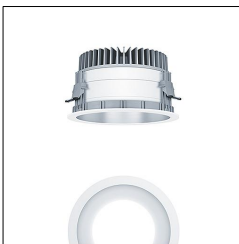
Plafonnier encastré à LED P-INF R200H LED2500-940 LDO SM WH 60818144

La présente déclaration de produit environnemental (EPD) est basée selon les normes EN ISO 14025 et EN 15804 et décrit les impacts spécifiques environnementaux du produit mentionné. Cette déclaration fait suite également aux exigences spécifiques et concrètes du programme Institut Bauen und Umwelt e.V. (IBU) selon les règles de calcul des LCA et le contenu de l'EPD (de base) selon les instructions de PCR sous-jacentes (PCR: Règles de catégorie de produit) pour «Luminaires, lampes et composants pour luminaires» (Ref: IBU PCR Teil A et B). Le produit décrit sert d'unité déclarée. La déclaration inclut une description du produit, des informations sur la composition des matériaux, la production, le transport, la phase d'utilisation, l'élimination et le recyclage, ainsi que les résultats de l'évaluation du cycle de vie. Elle est vérifiée par un organisme indépendant indépendamment conformément à la norme EN ISO 14025. Les EPD des produits de construction sont comparables uniquement si les valeurs sont calculées conformément au même PCR et des scénarios d'utilisation appropriés et obligatoires.