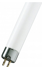
FT013CW/02 Basic T5 Short G5 13W 640