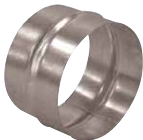
Raccord Mâle en aluminium

Le raccord mâle alu permet de raccorder deux conduits aluminium entre eux.