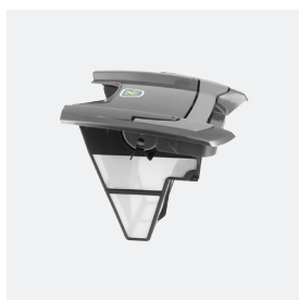
Bac filtrant (3L) débris fins 100 microns