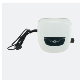
Boîtier de commande