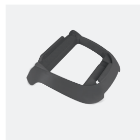
Socle pour boîtier de commande