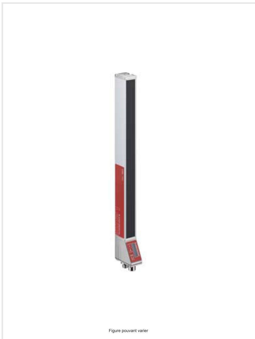
Figure pouvant varier