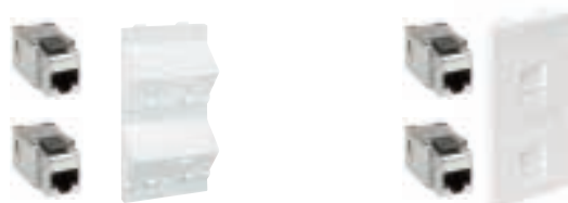
Plaques CIMA 500 de voix et données en page 134