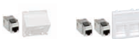
Plaques K45 de voix et données en page 118