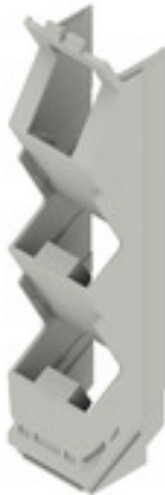
Illustration du produit