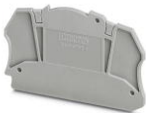
Flasque, largeur 2,2 mm

Remarque : les données indiquées ici sont tirées du catalogue en ligne. Vous trouverez toutes les informations et données dans la documentation utilisateur. Les conditions générales d'utilisation pour les téléchargements sur Internet sont applicables. ( http://phoenixcontact.fr/download )