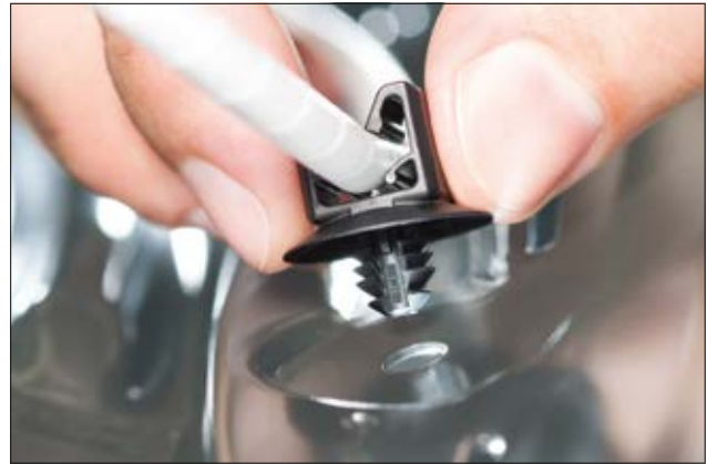
Clip HC48FT6 pour des diamètres de câbles de 4,3 à 5,2 mm.