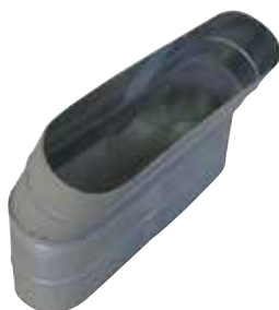
Coude Vertical Oblong 30°

Le coude vertical oblong 30° permet de changer la direction d'un réseau oblong de 30°.