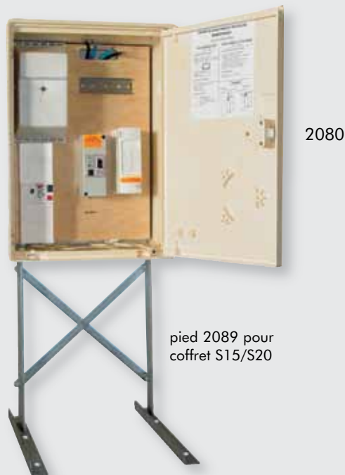
2080 ped 2089 pour coffret S15/S20