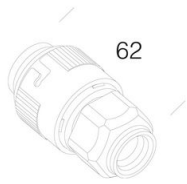
372 Prise pour connectique rapide