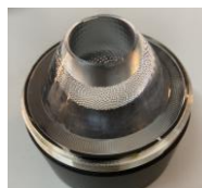
Nid d'abeille 50944/50945