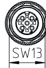
Schéma des pôles