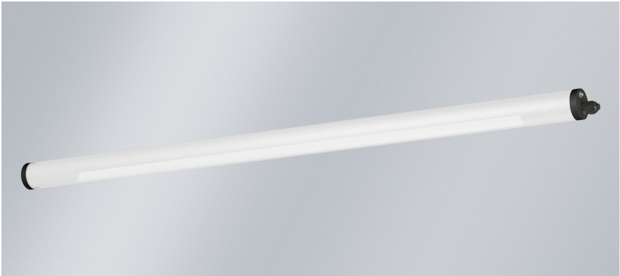
L'illustration peut différer