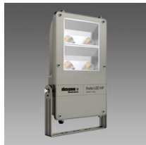
1898 Rodio HP - COB asymétrique