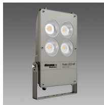
1897 Rodio HP - COB symétrique