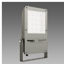
1890 Rodio LED HP - symétrique faisceau extensif