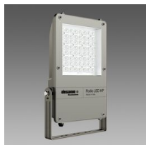
1888 Rodio LED HP - symétrique faisceau intensif