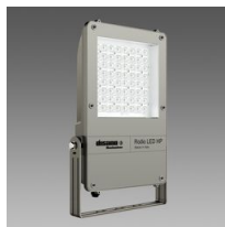
1887 Rodio LED HP - asymétrique