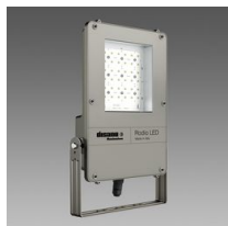
1890 Rodio LED - symétrique faisceau extensif