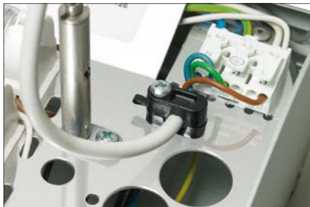
Clip Klam-Klip (KK), en application.