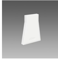
Embout de fermeture 1 - Sintesi