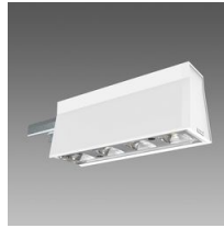
Sintesi Spot - UGR<22 - module lumineux