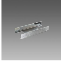
Étrier de jonction - Sintesi