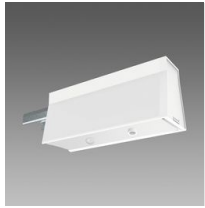
Sintesi Sensor - cellule de luminosité et/ou présence