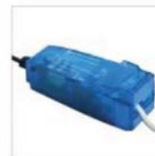
capot à clipsage rapide