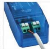
double bornier au:omatique