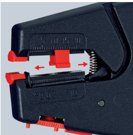
12 40 200: Butée longitudinale réglable

Sous réserve de toute modification technique et erreur.