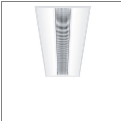
Luminaire encastré Lumière douce MLevo EA LED4800-840 M600L12 LDO KA WH 42184756