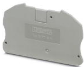
Flasque d'extrémité, Longueur: 75,4 mm, Largeur: 2,2 mm, Hauteur: 45,6 mm, Coloris: gris

Remarque : les données indiquées ici sont tirées du catalogue en ligne. Vous trouverez toutes les informations et données dans la documentation utilisateur. Les conditions générales d'utilisation pour les téléchargements sur Internet sont applicables. ( http://phoenixcontact.fr/download )