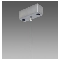
Suspension simple Q