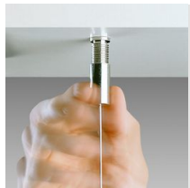
Suspension simple acier