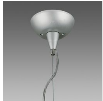
Suspension électrifiée 3-5 pôles