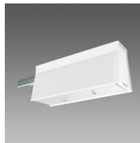
Sintesi Sensor - cellule de luminosité et/ou présence