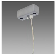
Suspension électrifiée Q