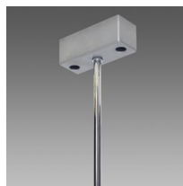
Suspension simple avec tiges Q