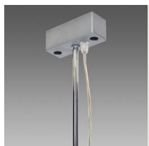
Suspension électrifiée avec tiges Q