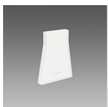
Embout de fermeture 1 - Sintesi