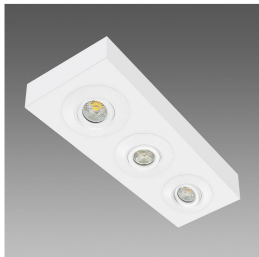
Spot Box Marte 3