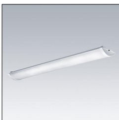
Plafonnier LED PRISMA LED4400-840 HFIX FR L1200 96630837

La présente déclaration de produit environnemental (EPD) est basée selon les normes EN ISO 14025 et EN 15804 et décrit les impacts spécifiques environnementaux du produit mentionné. Cette déclaration fait suite également aux exigences spécifiques et concrètes du programme Institut Bauen und Umwelt e.V. (IBU) selon les règles de calcul des LCA et le contenu de l'EPD (de base) selon les instructions de PCR sous-jacentes (PCR: Règles de catégorie de produit) pour «Luminaires, lampes et composants pour luminaires» (Ref: IBU PCR Teil A et B). Le produit décrit sert d'unité déclarée. La déclaration inclut une description du produit, des informations sur la composition des matériaux, la production, le transport, la phase d'utilisation, l'élimination et le recyclage, ainsi que les résultats de l'évaluation du cycle de vie. Les EPD des produits de construction sont comparables uniquement si les valeurs sont calculées conformément au même PCR et des scénarios d'utilisation appropriés et obligatoires.