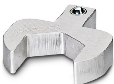
Clé de serrage spéciale, série: RF

https://www.phoenixcontact.com/fr/produits/1614347