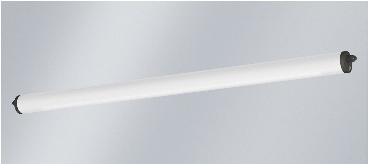
L'illustration peut différer