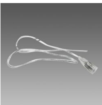
Connecteur avec câble - Strip LED IP65