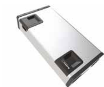
InspirAIR® Home SC 370 Classic Droite

Solution de ventilation double flux qui bat au rythme de la vie des occupants.