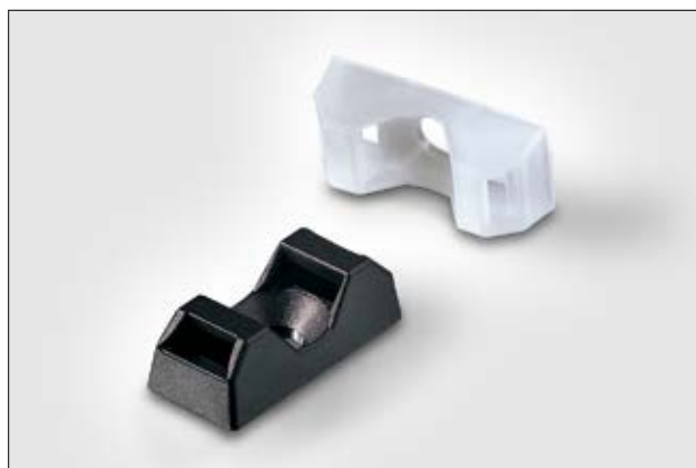
Embases à visser CTQM.