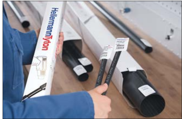
TREDUX MA47 conditionnée dans une boîte présentoir.