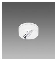
Acc. base pour adaptateur universel et GRAD. 1/10V-DALI