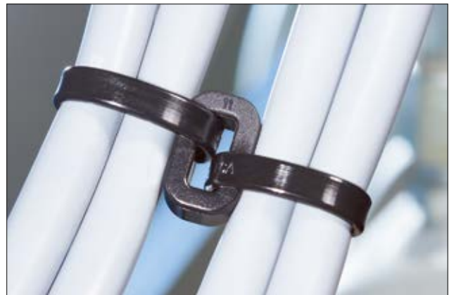
Écarteur LOK04 en application, pour du routage en parallèle.