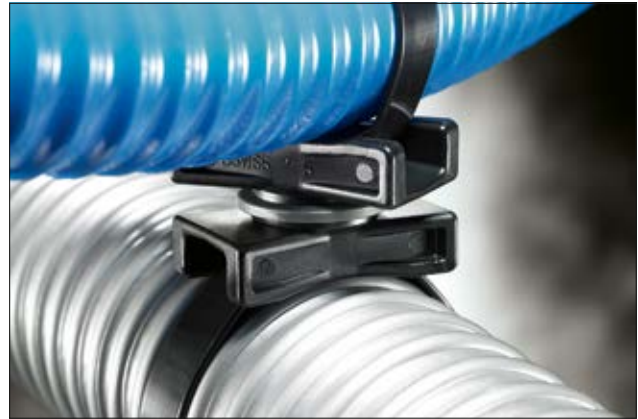
Embase rotative double, en application.