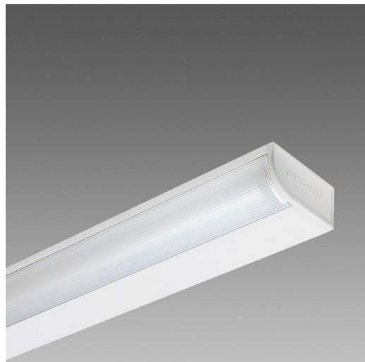
420 Rigo - LED