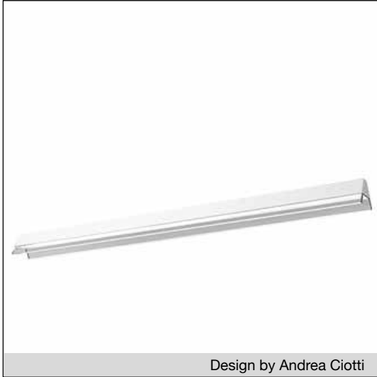
Design by Andrea Ciotti