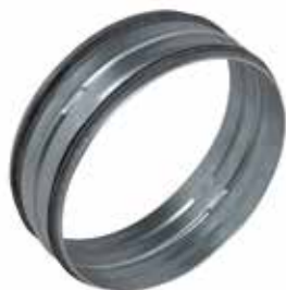
Raccord Mâle à joints

Le raccord mâle à joints permet de raccorder deux conduits galvanisés entre eux tout en assurant une étanchéité classe C.