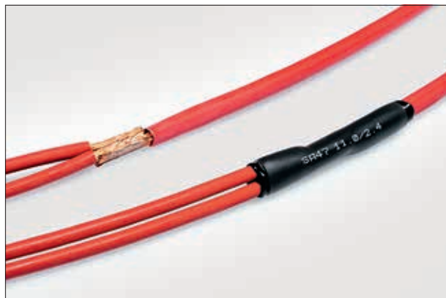
SA47, gaine thermorétractable, idéale pour les épissures de câbles.