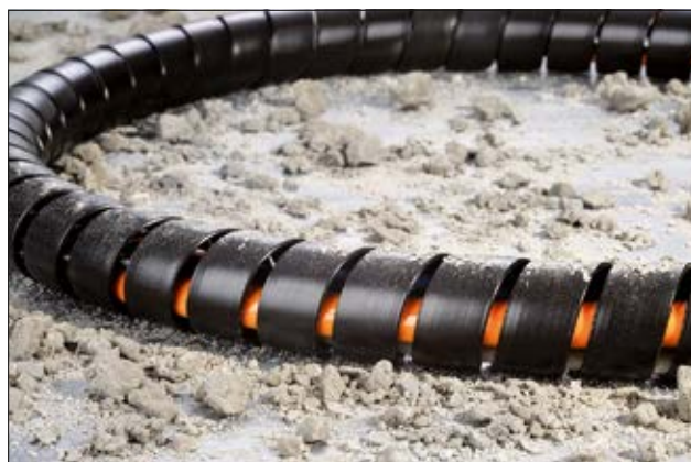
Frette spiralée SPF, extrêmement robuste et résistante à l'abrasion.