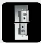
ROULEAU RÉGLABLE 4 MM