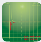
PROTECTION ÉLECTRONIQUE CONTRE L'EFFET DE SELF