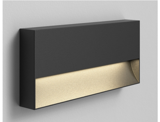
CODE: 1466002 FINISH: TEXTURED BLACK

This product is not suitable for installation within five miles of the coast. For these environments, please filter products on the astro website by 'coastal'.