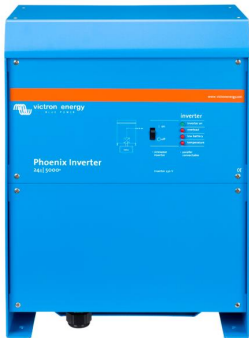
Phoenix Inverter 24/3000