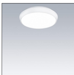
Applique murale/plafonnier LED NOVS S 1900-830 DI HFI WH 96635522

La présente déclaration de produit environnemental (EPD) est basée selon les normes EN ISO 14025 et EN 15804 et décrit les impacts spécifiques environnementaux du produit mentionné. Cette déclaration fait suite également aux exigences spécifiques et concrètes du programme Institut Bauen und Umwelt e.V. (IBU) selon les règles de calcul des LCA et le contenu de l'EPD (de base) selon les instructions de PCR sous-jacentes (PCR: Règles de catégorie de produit) pour «Luminaires, lampes et composants pour luminaires» (Ref: IBU PCR Teil A et B). Le produit décrit sert d'unité déclarée. La déclaration inclut une description du produit, des informations sur la composition des matériaux, la production, le transport, la phase d'utilisation, l'élimination et le recyclage, ainsi que les résultats de l'évaluation du cycle de vie. Les EPD des produits de construction sont comparables uniquement si les valeurs sont calculées conformément au même PCR et des scénarios d'utilisation appropriés et obligatoires.