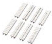
Repérage ZB, Rubans, blanc, repéré, impression longitudinale: numérotation continue 1-10, 11-20, etc. jusqu'à 491-500, Type de montage: Encliquetage dans la rainure de repérage élevée, pour bloc de jonction au pas de : 5,2 mm, Surface utile: 5,15 x 10,5 mm

Repérage ZB - ZB 5,LGS:FORTL.ZAHLEN - 1050017