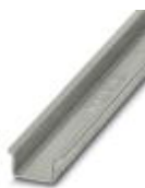
Profilé plein, Largeur: 35 mm, Hauteur: 15 mm, Longueur: 2000 mm, Coloris: argenté

Profilé plein - NS 35/15-2,3 UNPERF 2000MM - 1201798