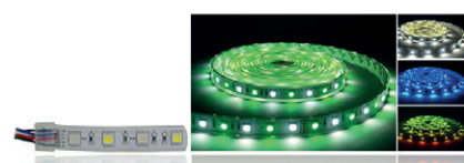
CONTROLEUR POUR BANDEAU LED RGB ET RGB +W